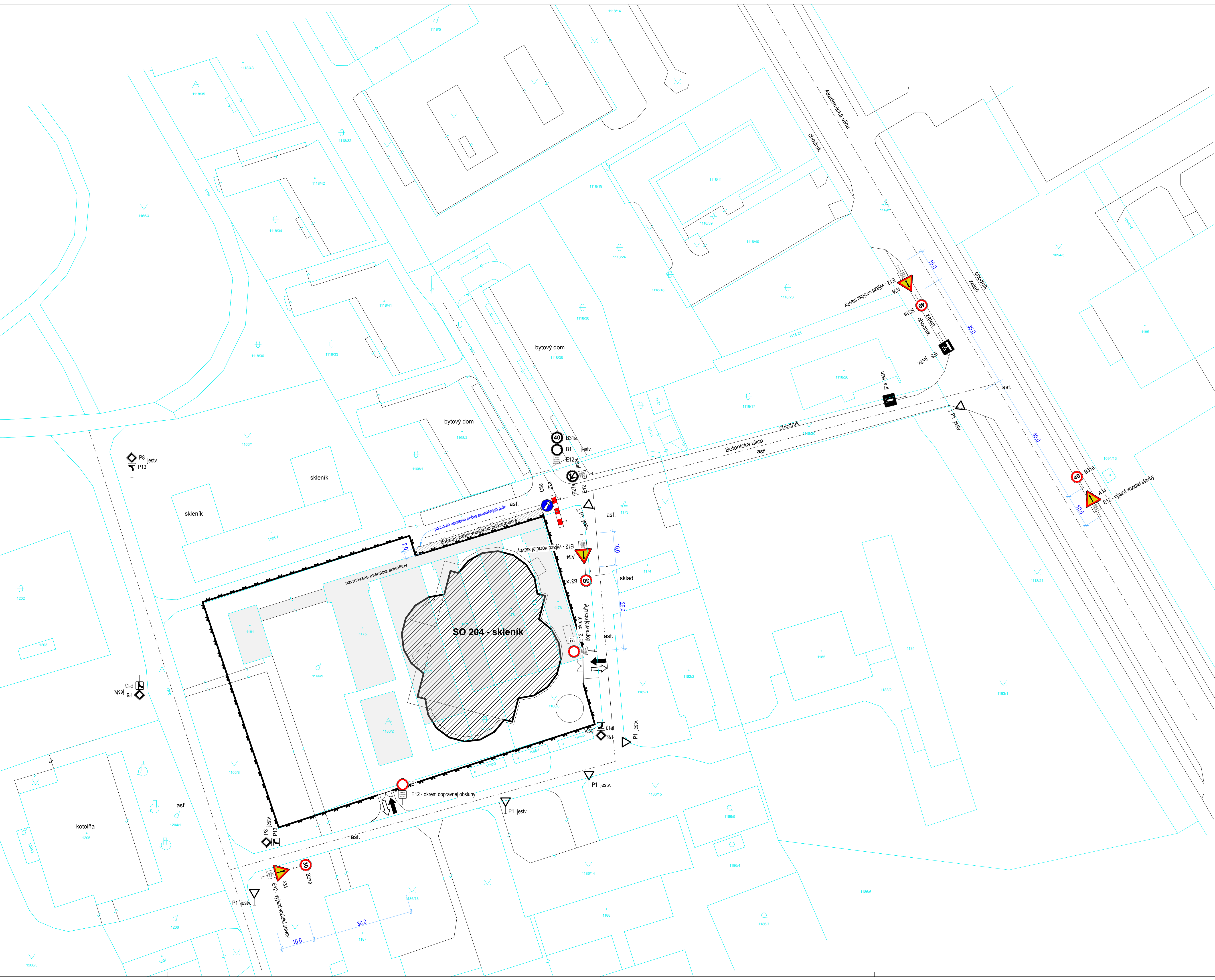
Dopravné trasy - situácia širších vzťahov